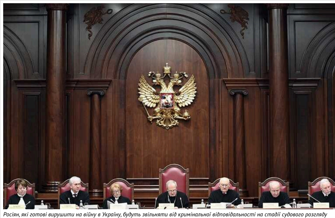
Росіян, які готові вирушити на війну в Україну, будуть звільняти від кримінальної відповідальності на стадії судового розгляду

В Росії громадян, готових вирушити на війну в Україну, будуть звільняти від кримінальної відповідальності на стадії судового розгляду.