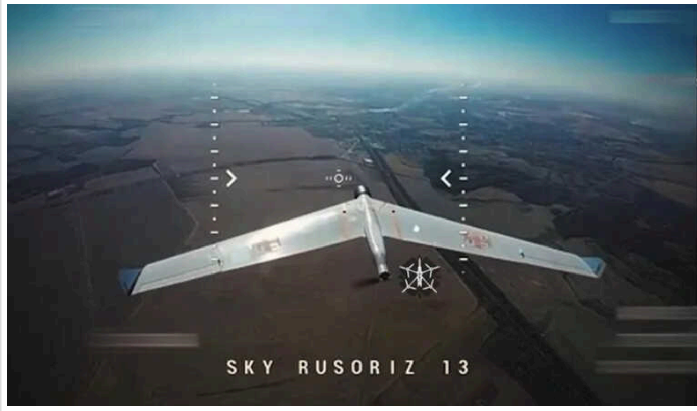
Окупанти почали встановлювати на дрони камери заднього огляду

Російські оператори розвідувальних дронів почали встановлювати на свої БПЛА камери для заднього огляду. Це робиться для захисту від атак українських FPV-дронів.