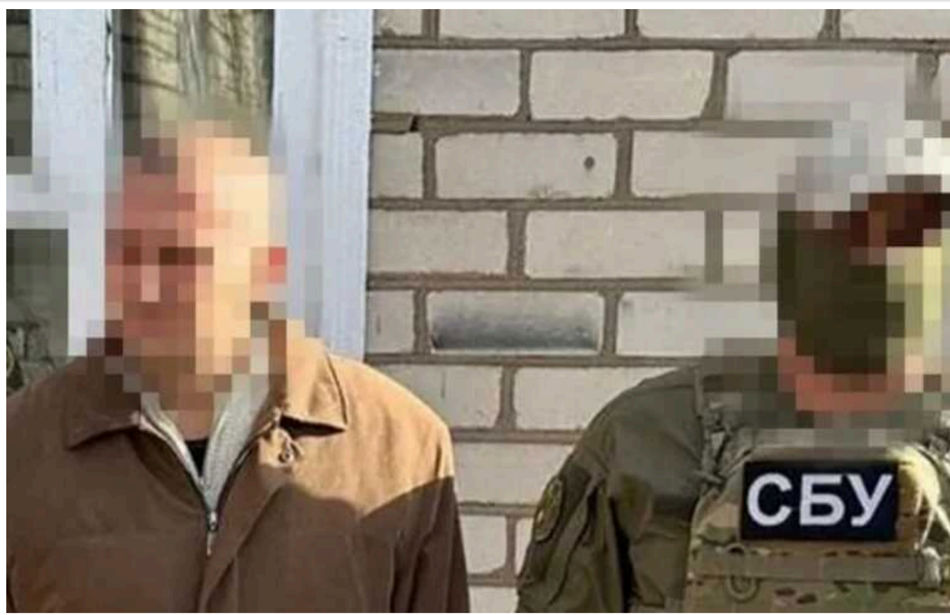
СБУ та ДБР затримали колаборанта, який сприяв росіянам у катуванні українців під час окупації Херсона

Правоохоронці затримали колишнього інспектора херсонської виправної колонії, який після захоплення обласного центру запропонував свої "послуги" загарбникам. Зрадник допомагав російським окупантам катувати українців.