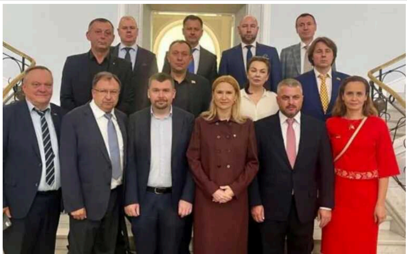
У Варшаві розпочалося перше за 4 роки засідання Парламентської асамблеї Україна-Польща

У Варшаві розпочалося засідання Парламентської асамблеї Україна-Польща.