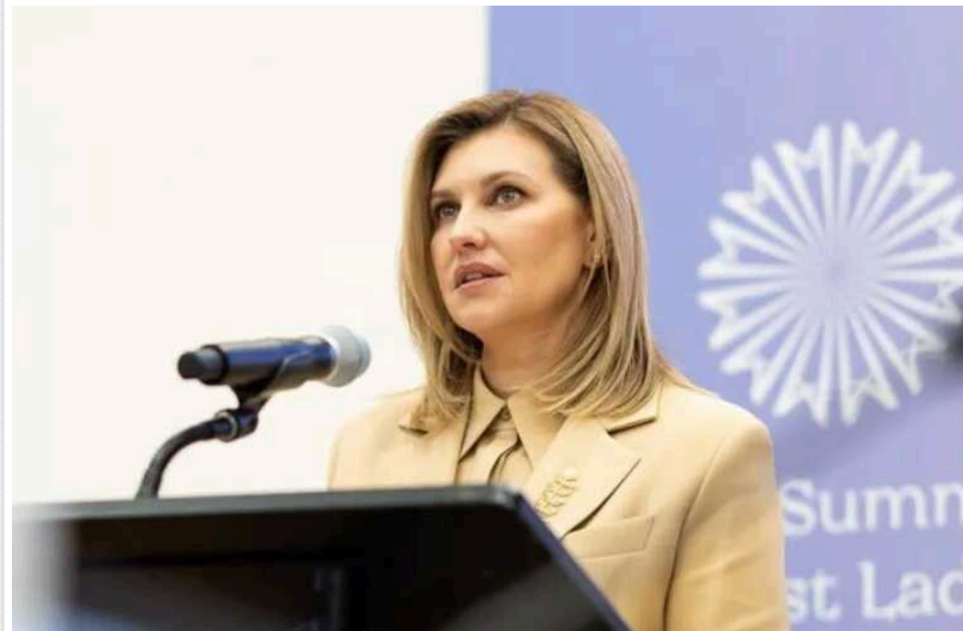
Олена Зеленська в пісочному костюмі з символічною брошкою КВІТКА взяла участь у Саміті майбутнього ООН, що проходив у Нью-Йорку

Перша леді України Олена Зеленська виступила на Саміті майбутнього ООН у Нью-Йорку, який став платформою для розширення міжнародного діалогу щодо захисту дітей. Громадська діячка з'явилася на офіційному заході в стриманому образі, який доповнила символічною брошкою КВІТКА.