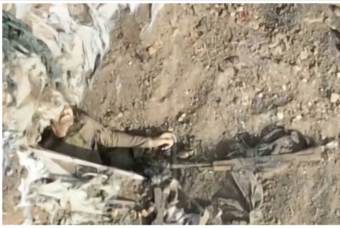
У мережі опублікували відео, як рука окупанта тягне ліквідованого російського загарбника в бліндаж

Бійці 1-го штурмового батальйону 92-ої окремої штурмової бригади на Харківському напрямку атакували російських загарбників точними скидами боеприпасів з дрона.