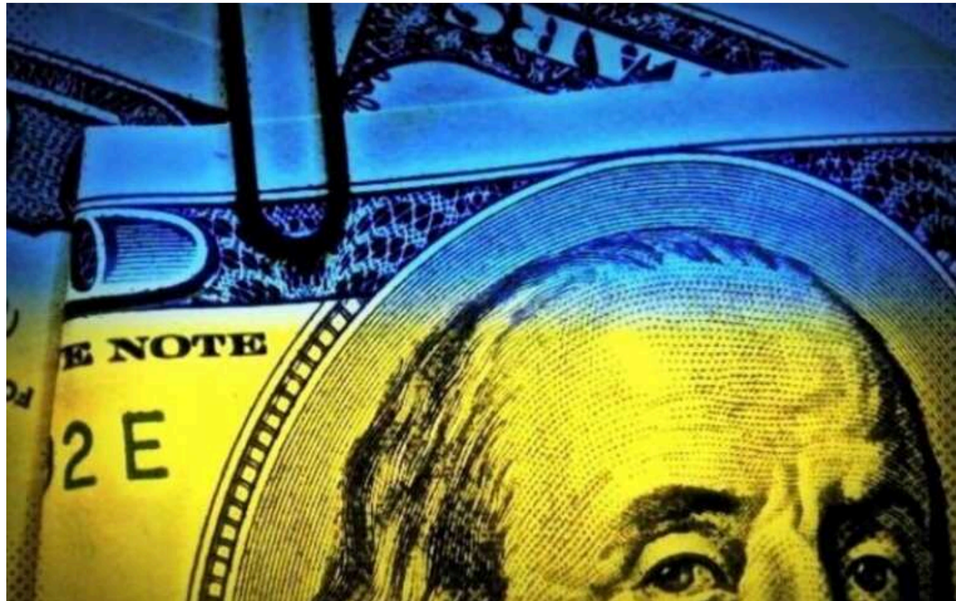
Державний борг України наступного року знизиться зі 100,5% до 97% ВВП - Мінфін

У Міністерстві фінансів сподіваються на зниження державного боргу у 2025 році з 100,5% до 97% ВВП.