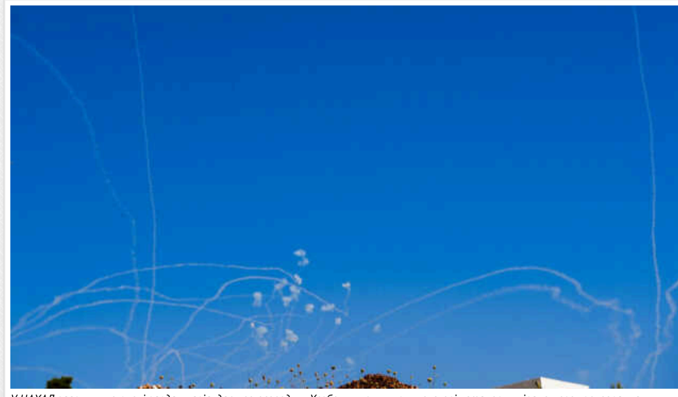
У ЦАХАЛ заявили, що вночі завдали авіаудару по осередку «Хезболли», знищивши пускові установки ліванського угруповання

Цю інформацію повідомляє Times of Israel.