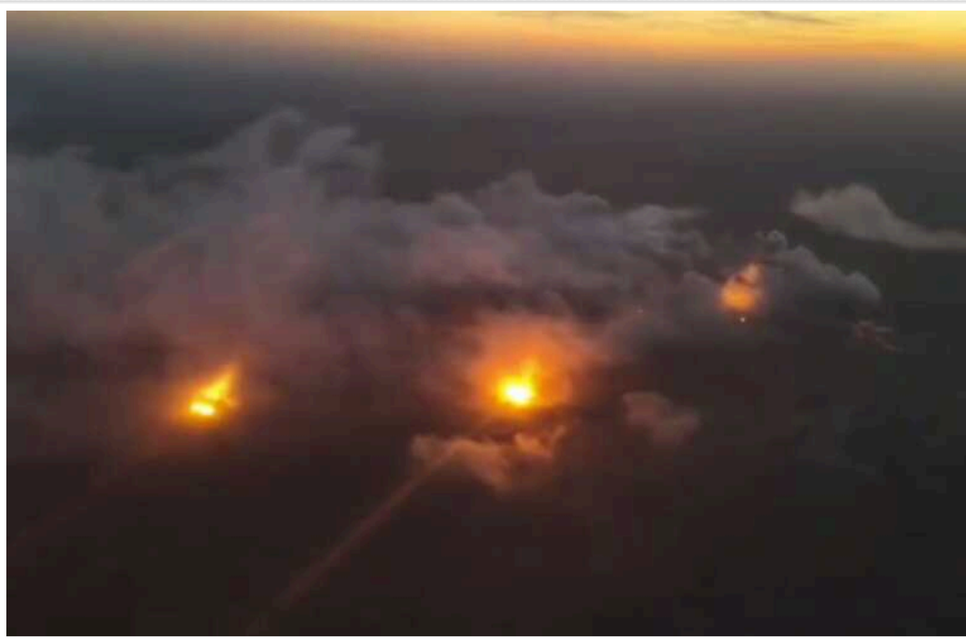
В мережі публікують кадри ранкового обстрілу Вугледара

За даними бійців ЗСУ, російські війська вже зайшли на околиці міста.