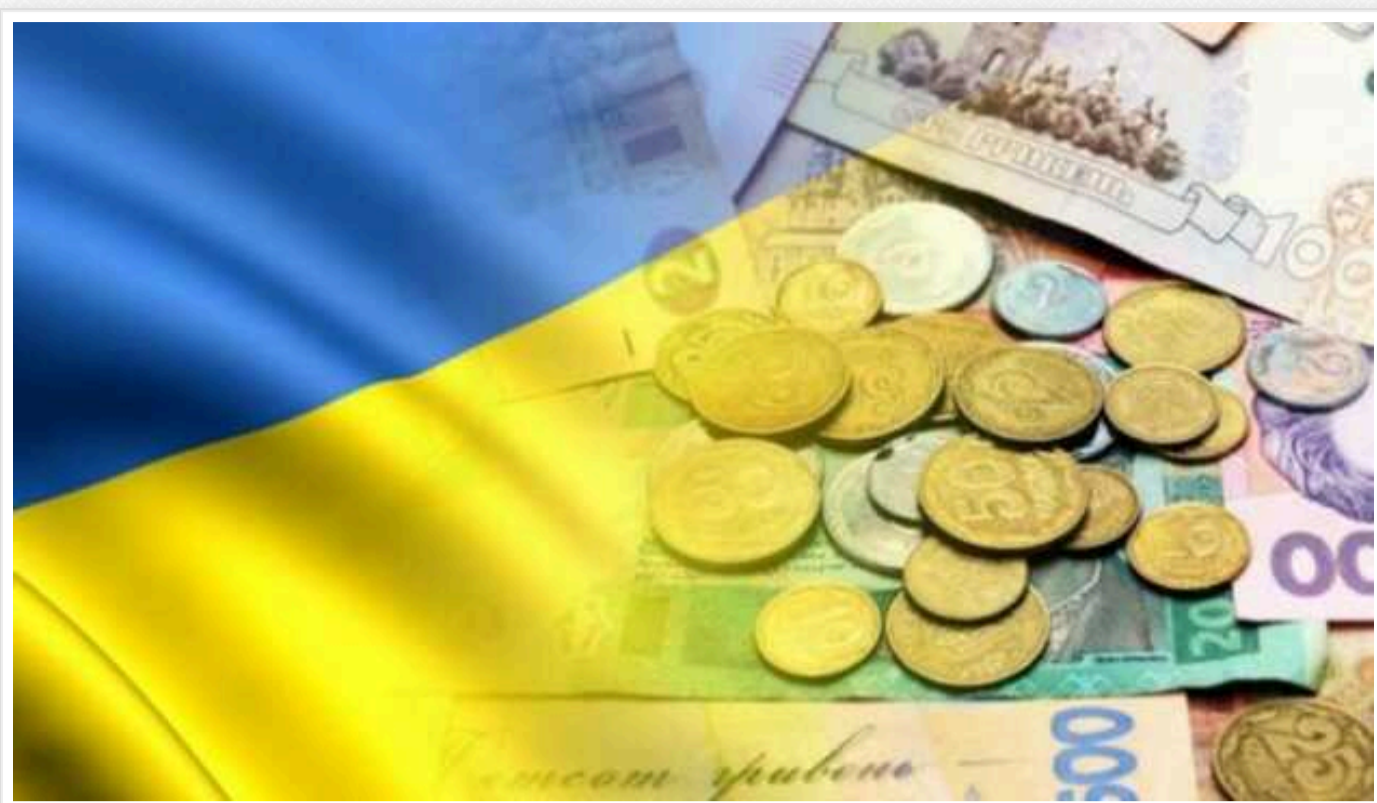
Вартість на продукти збільшиться: у жовтні ціни на хліб зростуть на 5-10%, - Мінфін