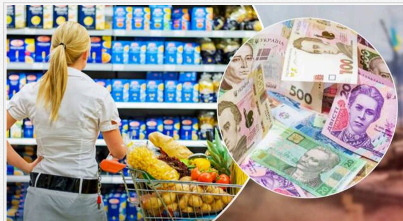
Зміна цін виробників промислової продукції у серпні 2024 року (до відповідного місяця попереднього року) (відсотків)

Найбільше зросли ціни на виробництво молочних продуктів – на 17,8%, та на м'ясо – на 16,4%.