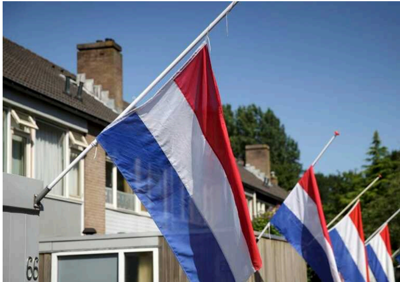
Нідерланди виділять Україні 209,5 мільйона євро для відновлення життєво важливої інфраструктури

Нідерланди виділять 209,5 млн євро на відновлення критичної інфраструктури України.