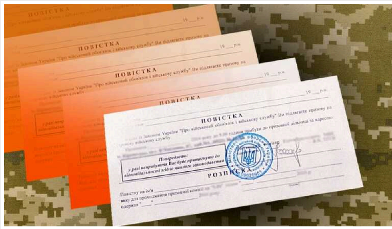
Кабмін виділив на розсилання 900 тисяч заочних повісток майже 72 мільйони гривень

Таким чином, за одну повістку доведеться заплатити 80 гривень.