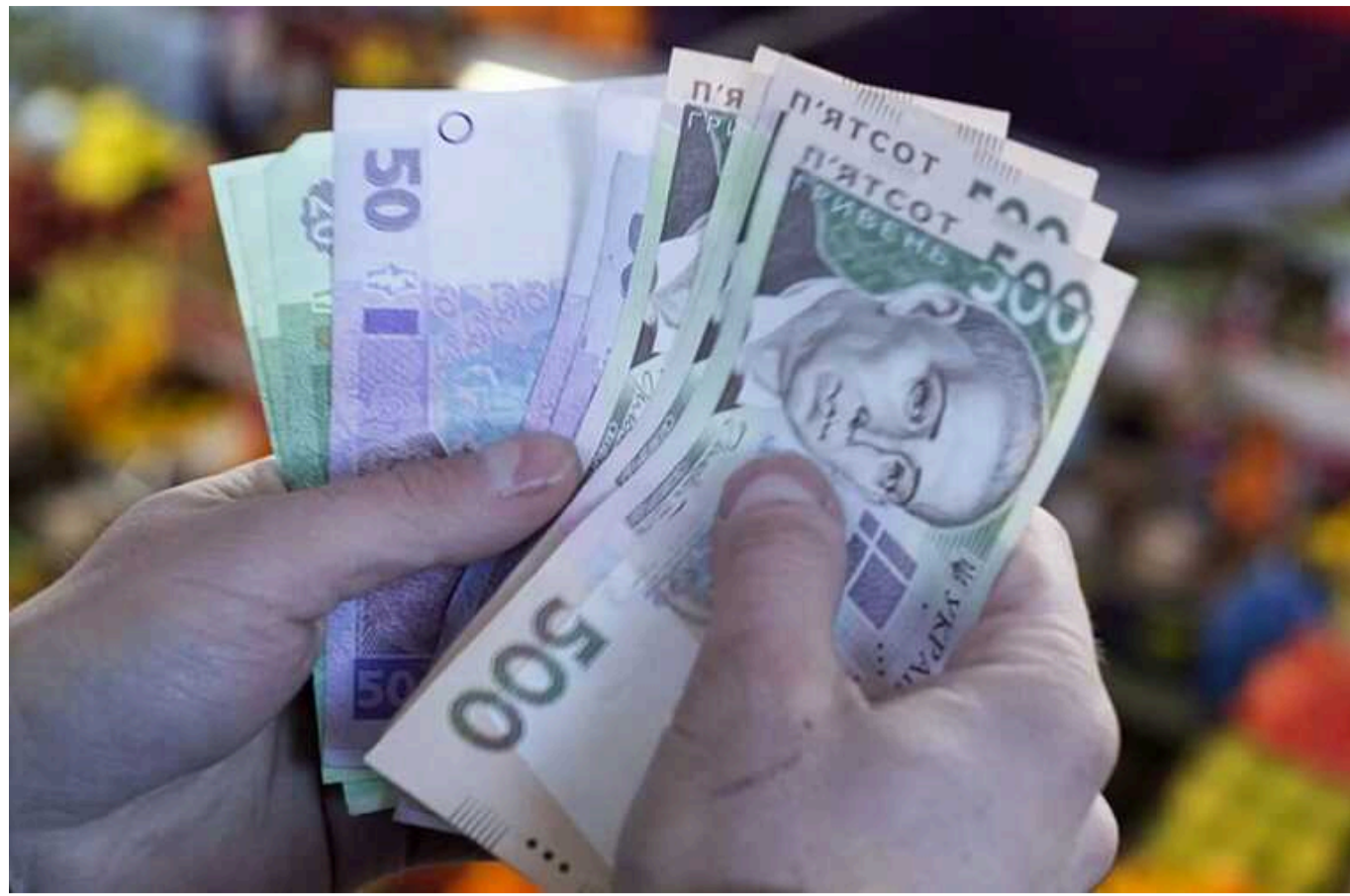
Українці можуть отримати грошову допомогу від Японії

Розмір благодійної допомоги становить 3600 гривень на особу, її її виплачуютимуть одразу за три місяці.