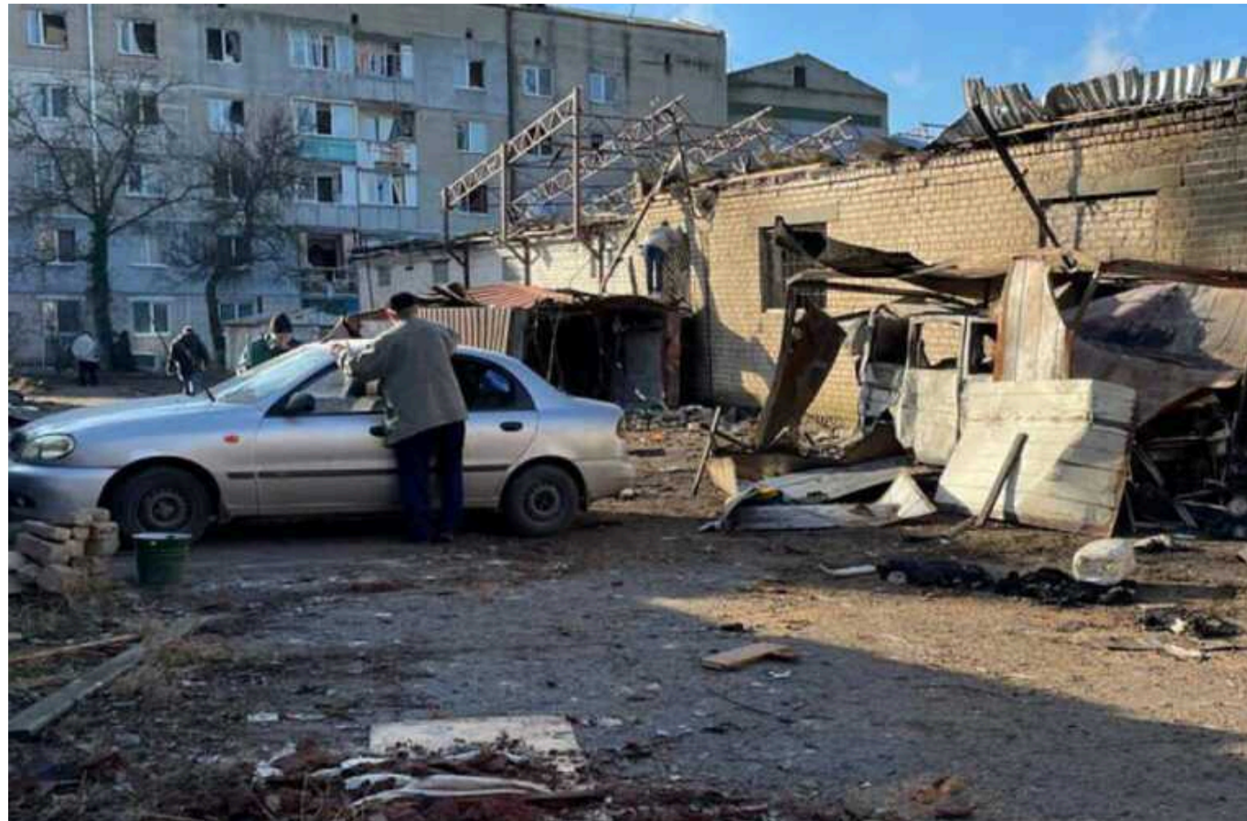
В окупованому Маріуполі перекупники реалізують автомобілі загиблих українців, – міськрада

Автомобілі вивозять із міста, підкупаючи місцевих "правоохоронців". А потім їх продають за ринковими цінами.