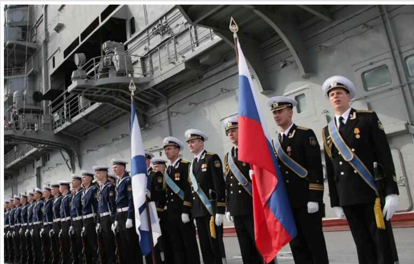
Як Кремль компенсує втрати в Україні

Росія активно шукає нові людські ресурси для війни в Україні. Часто в окопи кидають "непрофільних" спеціалістів: моряків, а також військових з ПКС і ПДВ. Проте великі втрати не є показником швидкої перемоги над агресором: військові аналітики говорять про високий потенціал збройних сил РФ.