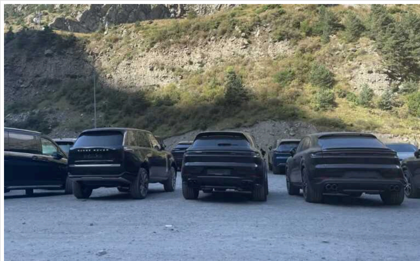
ЗМІ виявили нову схему контрабандного постачання елітних автомобілів до Росії

Дорогі преміальні автомобілі потрапляють до Росії транзитом через Грузію. На грузинсько-російському кордоні було виявлено десятки елітних машин.