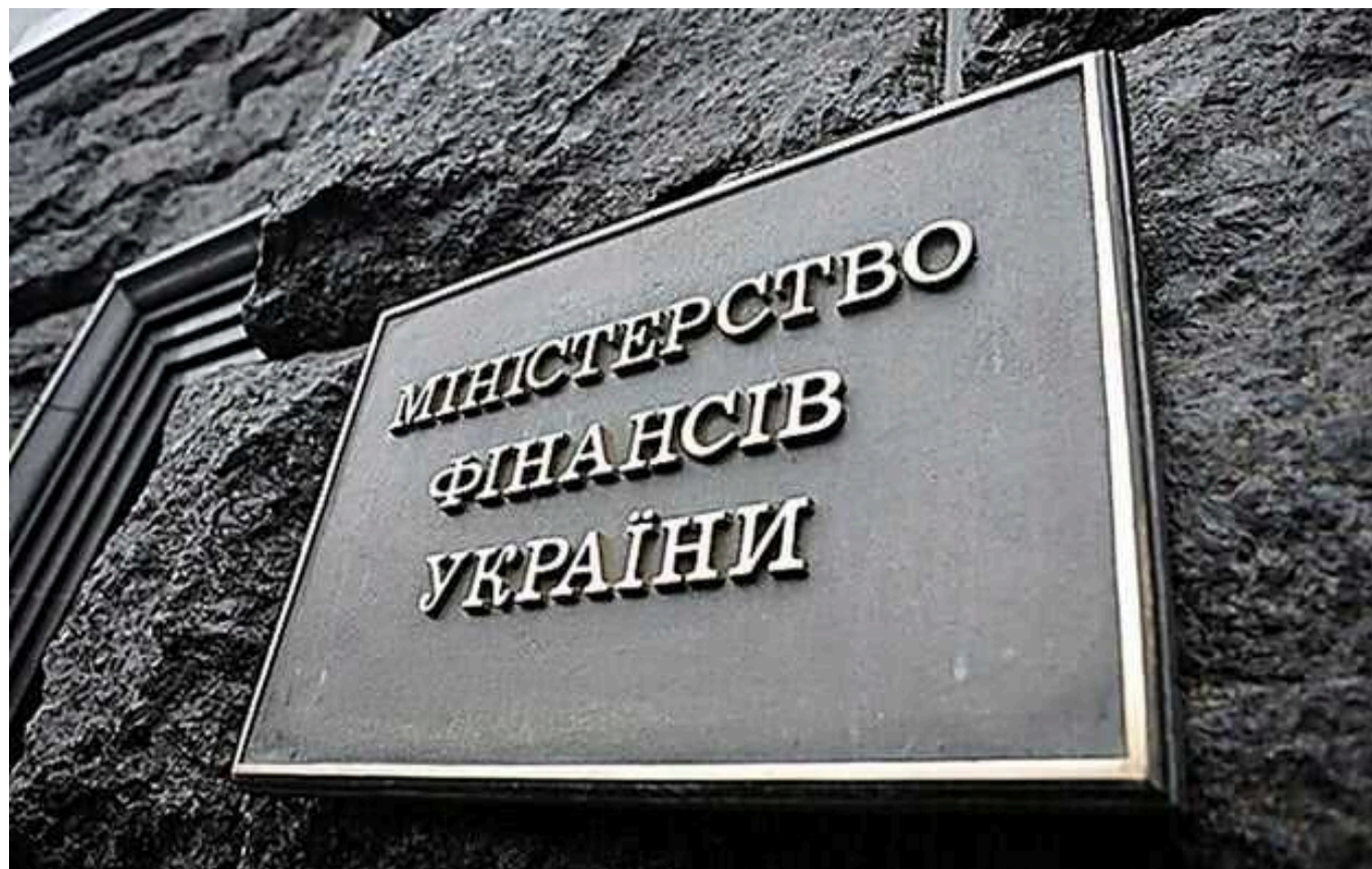
Шантаж чи переговори: Як банківська галузь тисне на Мінфін через податки

А тепер слухайте уважно. Це вже не мої інсайди, а публічна заява народного депутата в телемарафоні, що банківська галузь дійсно шантажувала Мінфін та НБУ, погрожуючи, що якщо в податковому законопроекті буде податок на їхній прибуток у 50%, то вони будуть саботувати купівлю ОВДП на більш ніж 200 млрд грн.