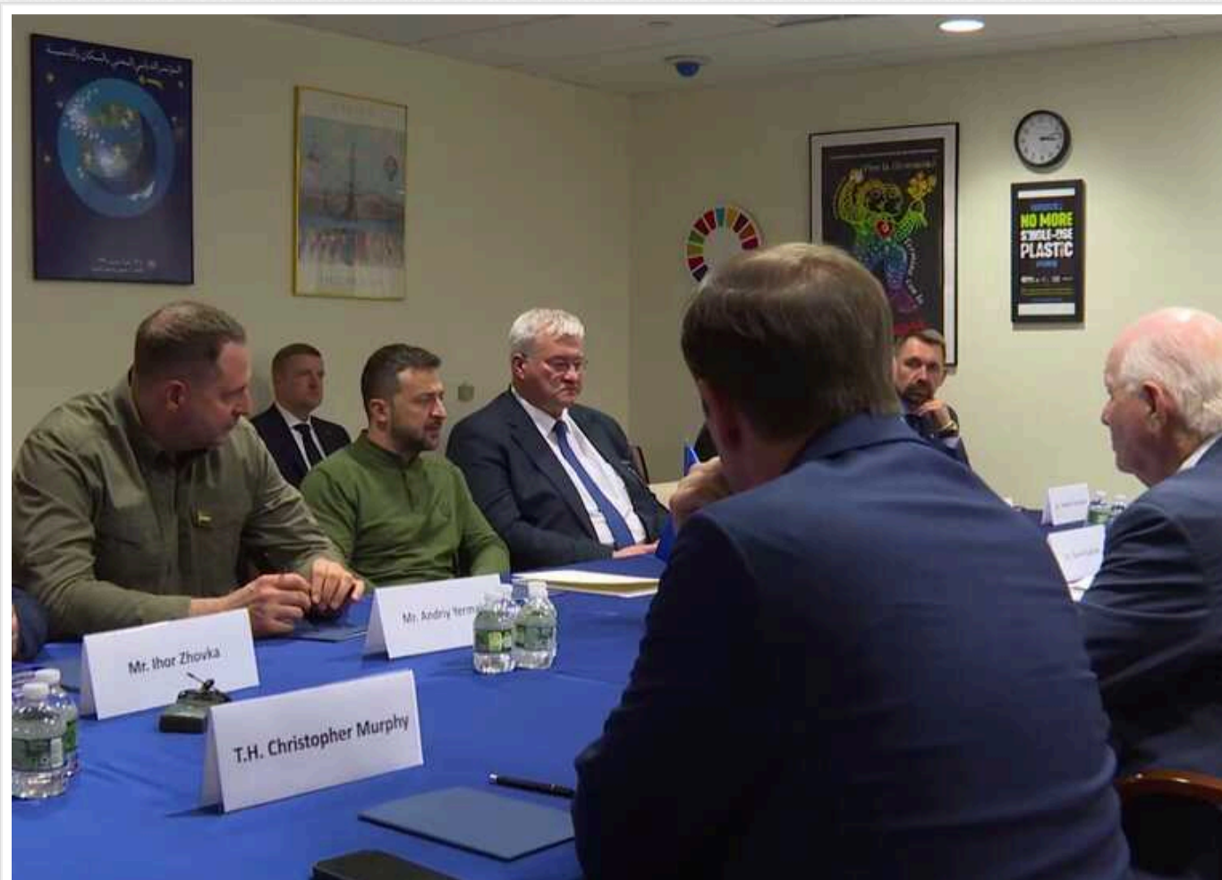
Зеленський поділився актуальним прогнозом про терміни закінчення війни

За підсумками зустрічі з двопартійною делегацією Конгресу США президент зазначив, що "рішучі дії в цей момент можуть сприяти справедливому завершенню російської агресії проти України в наступному році".