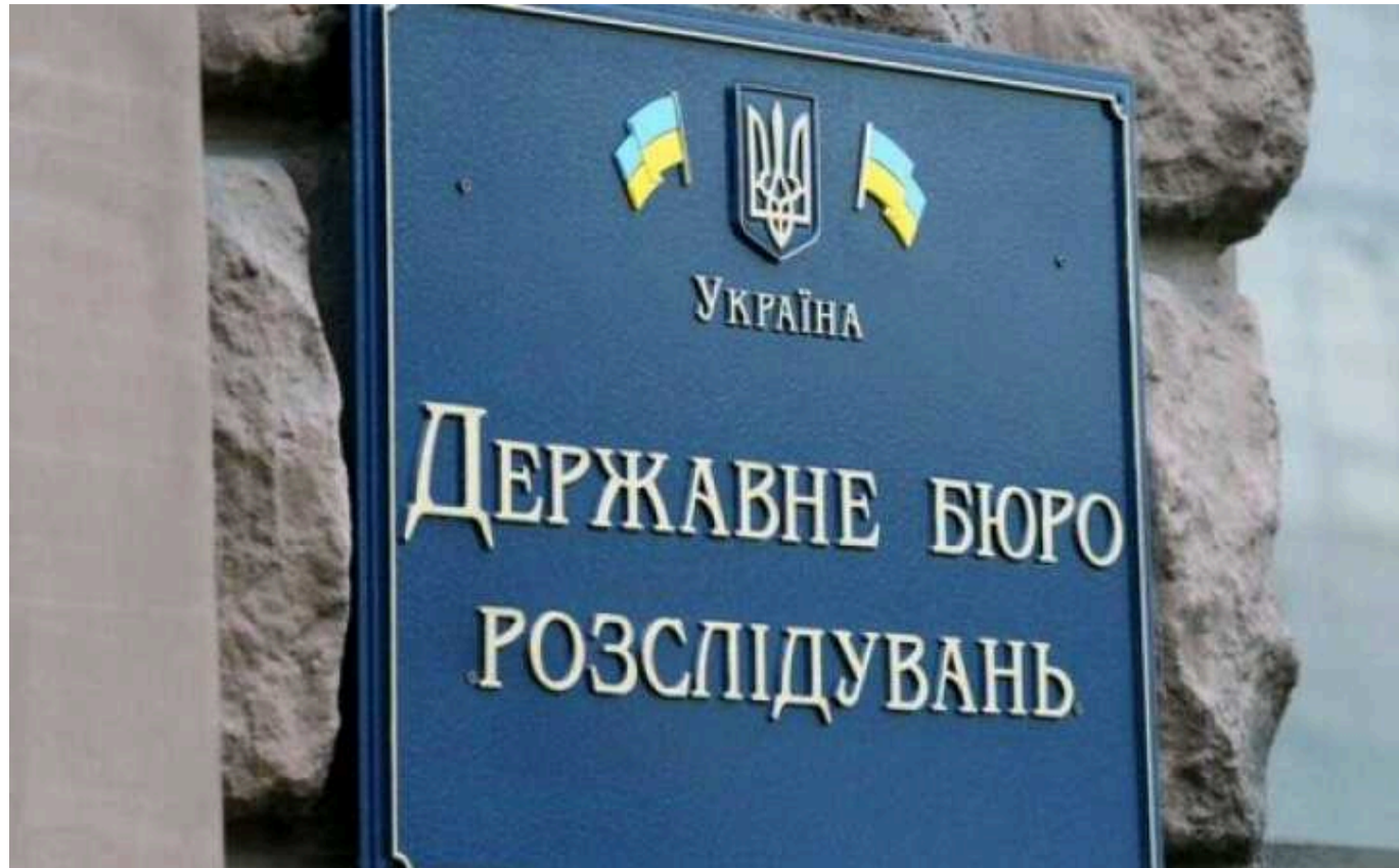
ДБР скерувало до суду справу щодо розкрадання сотень мільйонів гривень посадовцями Полтавського ГЗК

До суду направлено обвинувальний акт проти семи посадовців та службових осіб ПрАТ "Полтавський гірничо-збагачувальний комбінат" (Полтавський ГЗК). Їх звинувачують у розкраданні понад 370 млн гривень.