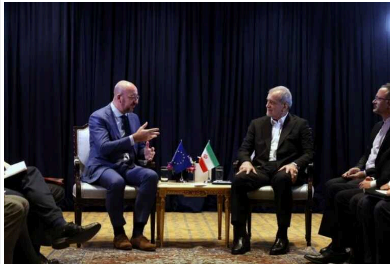
WSJ: Голова Євроради на зустрічі з президентом Ірану тиснув на нього через постачання ракет до РФ

Шарль Мішель провів зустріч із президентом Ірану Масудом Пезешкіаном. Сторони обговорили питання постачання іранських ракет до Росії.