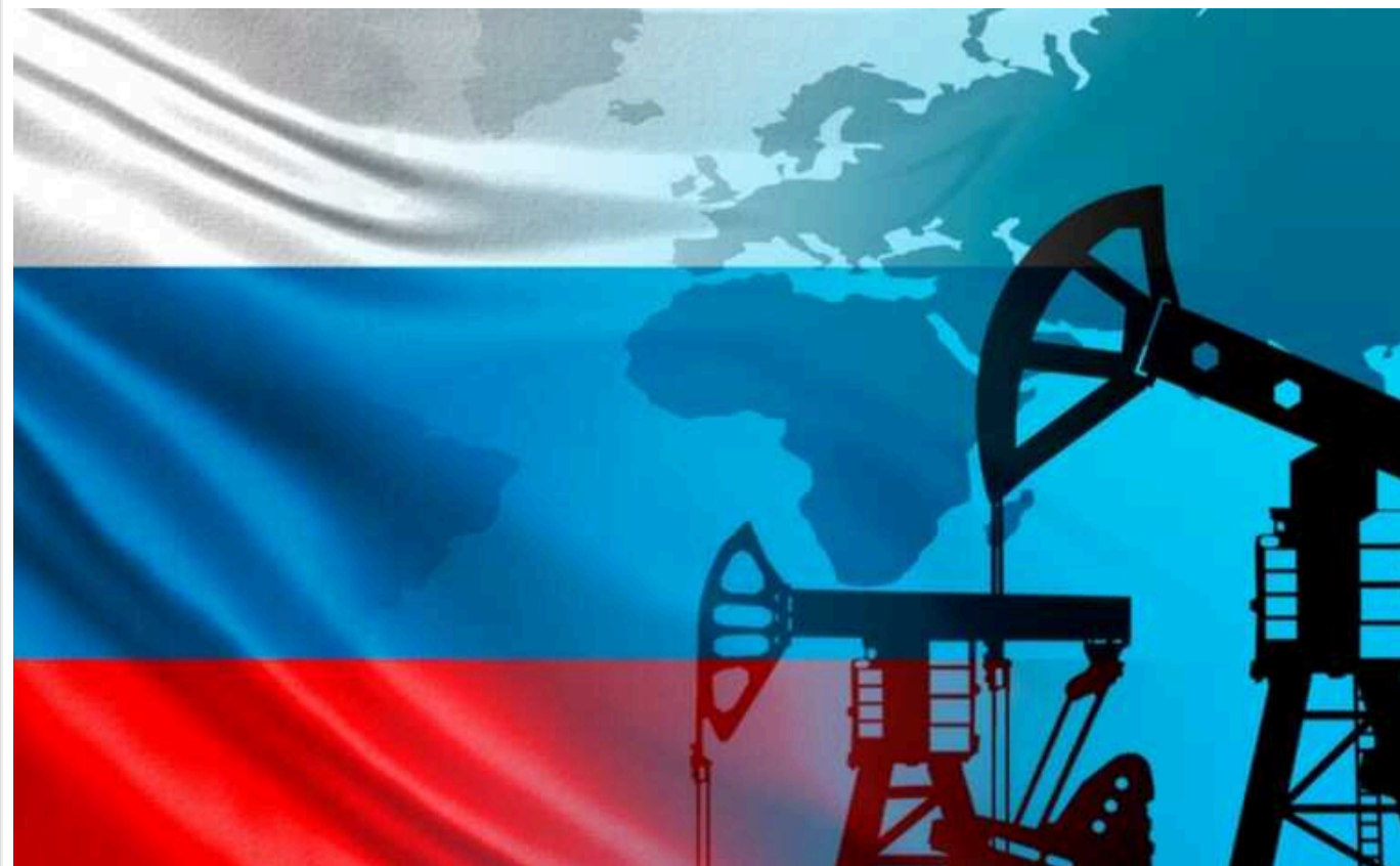
Bloomberg: Росія очікує зменшення доходів від газу та нафти протягом наступних трьох років

Російський уряд прогнозує, що впродовж найближчих трьох років доходи бюджету від продажу нафти та газу зменшаться. Згідно з попередніми оцінками, виручка знизиться на 14% у період з 2024 до 2027 року.