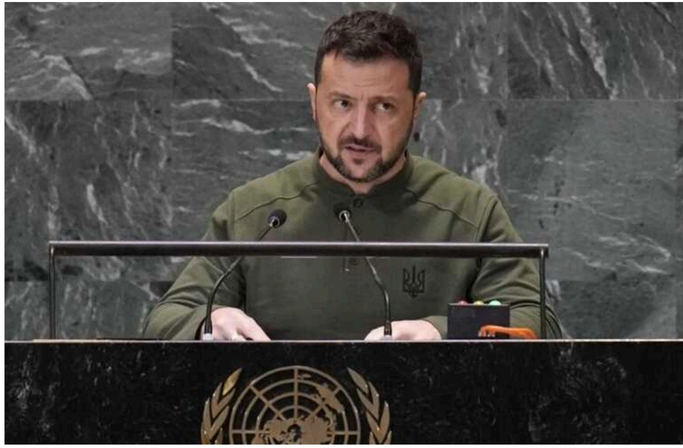
Зеленський: Україна продовжує роботу над наступними пунктами Формули миру

Президент Володимир Зеленський виступив на Саміті майбутнього, який розпочався в штаб-квартирі ООН у Нью-Йорку. Він зазначив, що Україна поступово просувається в реалізації раніше обговорених пунктів Формули миру та працює над наступними.