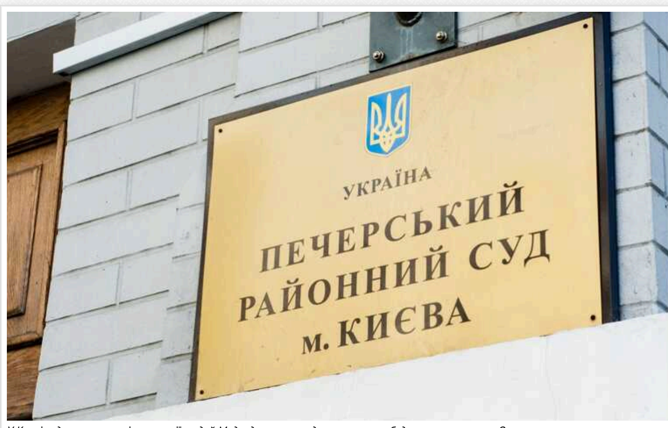
У Києві суд зняв арешт із компанії людей Медведчука, яка веде незаконну забудову на столичних Осокорках

Печерський районний суд Києва знову підтвердив, що він "найуманніший" до ескрегіоналіз? Цього року ця інстанція вкотре знала арешт із майна ПП "Вікторія" – однієї з компаній "клану" Віктора Медведчука, яка має стосунок до підозрілої забудови на столичних Осокорках. У результаті сумнівні будівельні роботи тривають повним ходом, а держава не може націоналізувати та взяти під контроль активи зрадника.