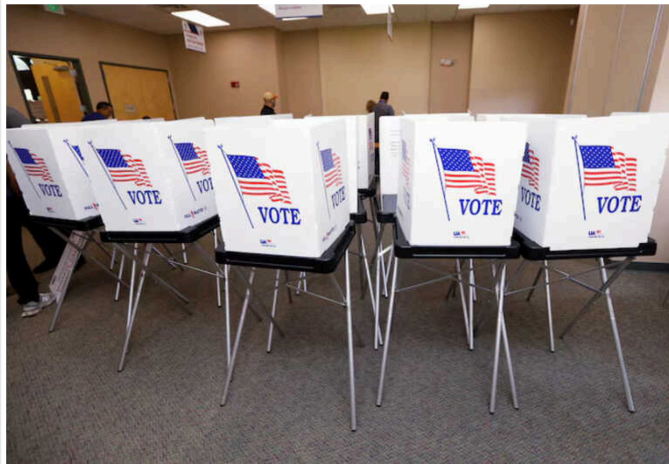
Росія використовує ШІ для впливу на вибори в США, - розвідка

Росія генерує більше контенту з використанням штучного інтелекту з метою впливу на президентські вибори в США, ніж будь-яка інша країна.