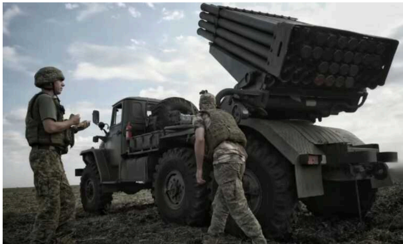
Втрати ворога: Сили оборони відмінували ще 1400 окупантів і 16 танків

Протягом минулої доби сили оборони знищили 1 400 російських військовослужбовців, 61 артилерійську систему, 40 бойових броньованих машин та 16 танків.