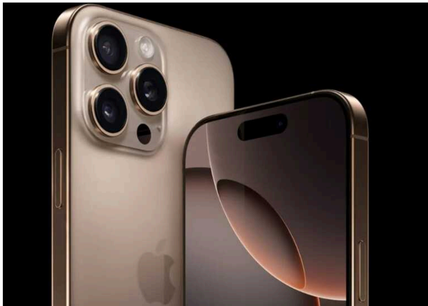
Новий iPhone 16 Pro "розібрали на запчастини" та виявили дивний акумулятор

Розбирання iPhone 16 Pro виявило, що деякі компоненти суттєво відрізняються від попередніх моделей, зокрема, пристрій оснащено більшим блоком камер.