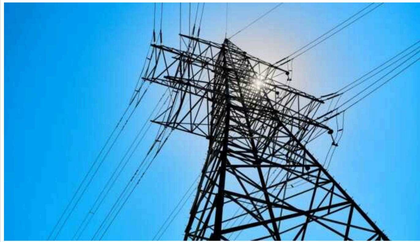
На Полтавщині уламки дронів завдали шкоди енергетичній інфраструктурі

Внаслідок падіння уламків збитих російських безпілотників у Полтавській області постраждала енергетична інфраструктура, через що без електрики залишилися 20 населених пунктів.