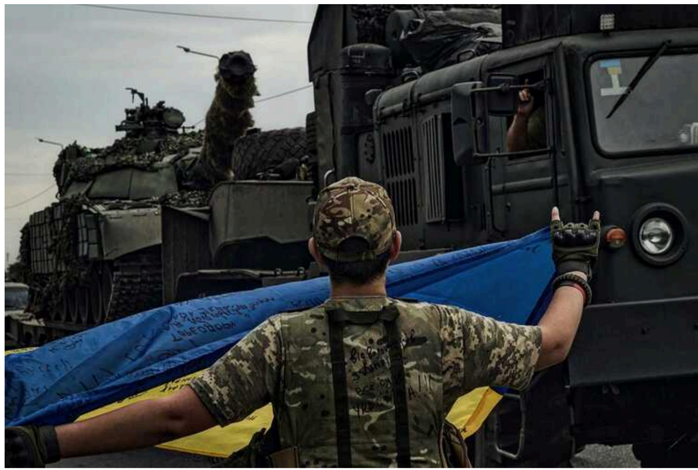
Forbes: 72-а бригада, яка захищає Вугледар, може опинитися в оточенні

Бригада чисельністю дві тисячі осіб, «безумовно, втомилася» після 20 місяців бойових дій на Вугледарському виступі.