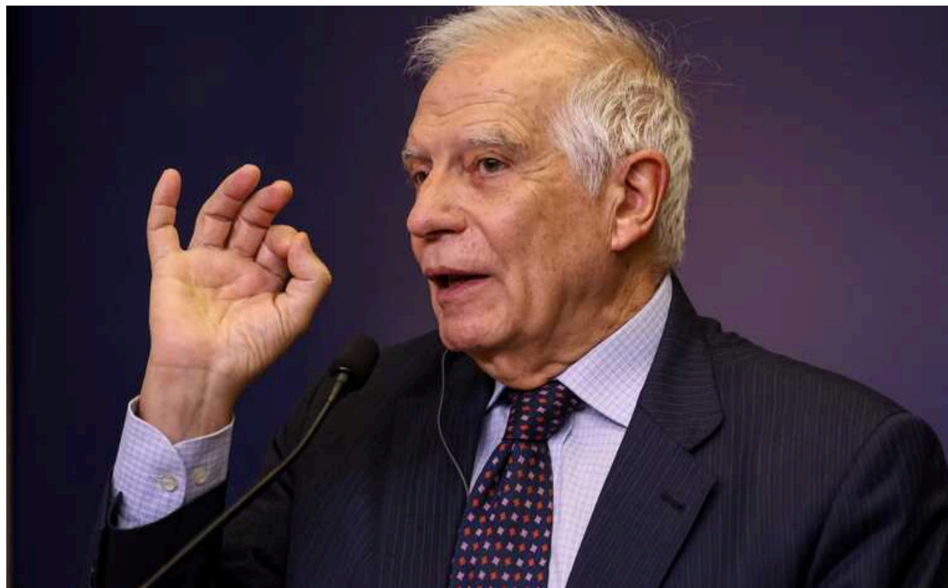
Захід повинен збільшити підтримку, щоб не дозволити Росії занурити Україну в темряву, - Боррель

Росія намагається зруйнувати енергетичну інфраструктуру України напередодні зими, щоб залишити її в темряві та холоді. Західні союзники Києва повинні активізувати постачання Україні засобів протиповітряної оборони.