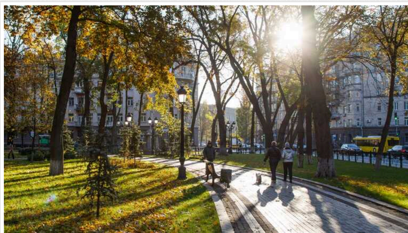
В Україні очікується тепла та сонячна погода, - синоптик

Сьогодні наша країна стане однією з найтепліших у Європі.