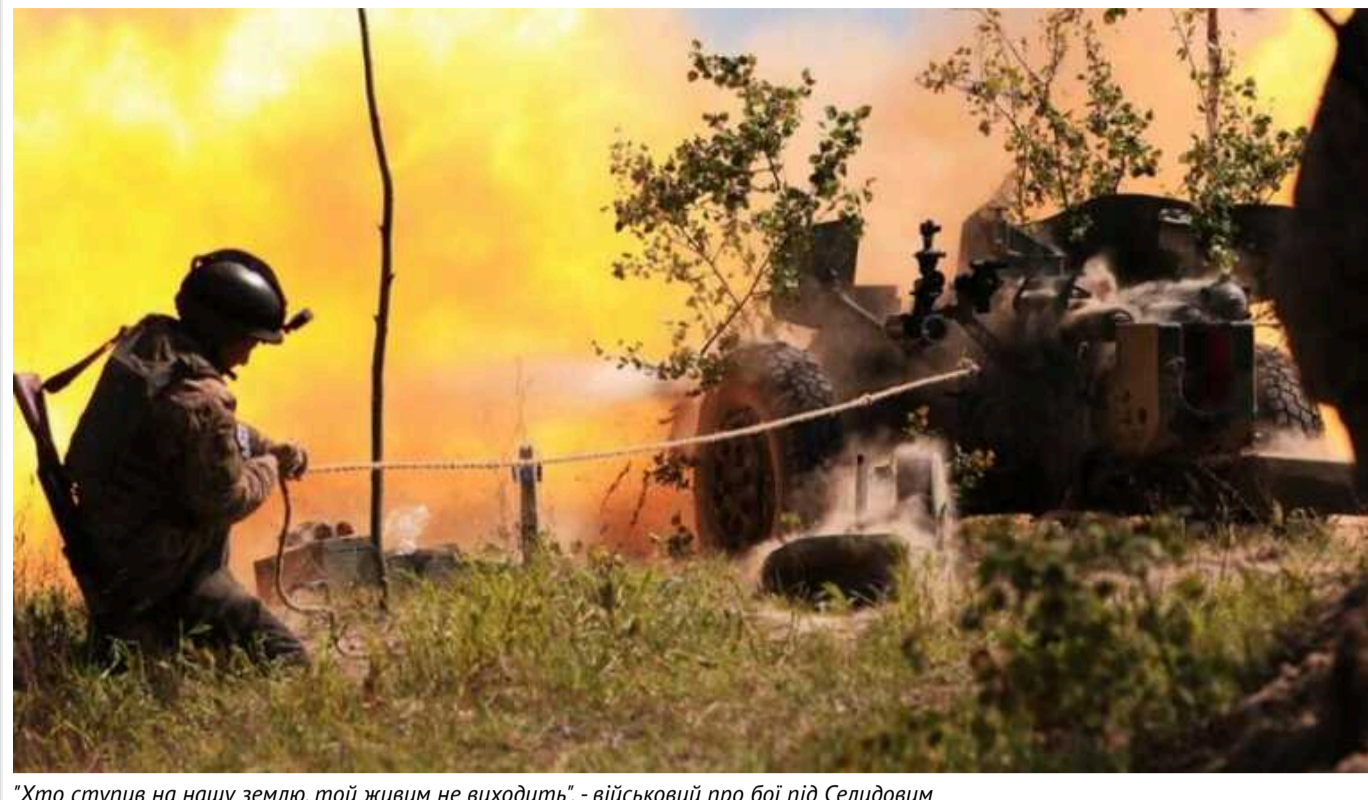
"Хто ступив на нашу землю, той живим не виходить", - військовий про бої під Селидовим

Російські військові наразі застосовують тактику малих груп і намагаються наблизитися до околиць Селидового.