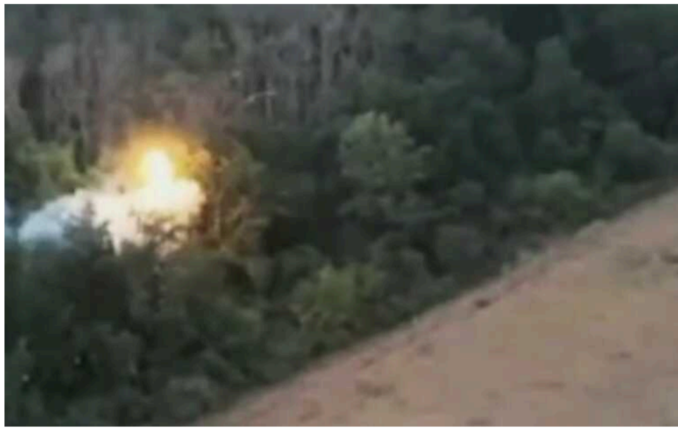
У Defense Express розповіли, як можна використовувати "дрони-дракони" для знищення САУ

Під час проведення експериментів було встановлено, що при використанні запалювальної суміші без вентиляційних систем температура горіння броні значно зростала. Якщо вентиляцію не вмикати, перебувати у бойовому відділенні стає неможливо через токсичний дим.