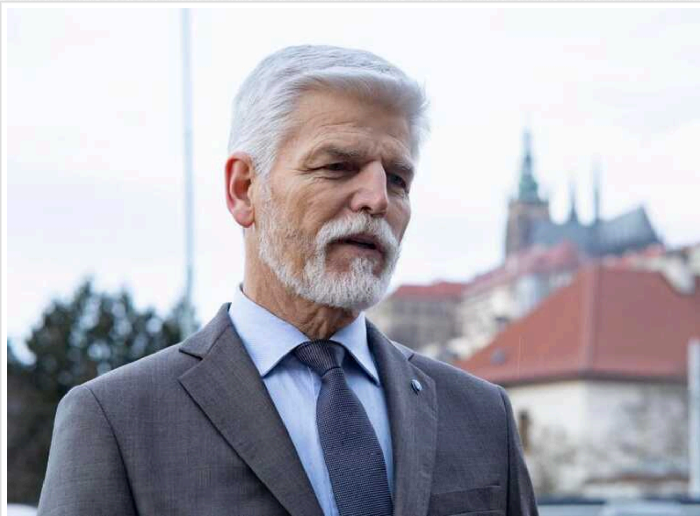
Києву слід визнати, що деякі території можуть залишатися під контролем Росії протягом кількох років, - Петр Павел

Це заявив президент Чехії Петр Павел в інтерв'ю виданню The New York Times.