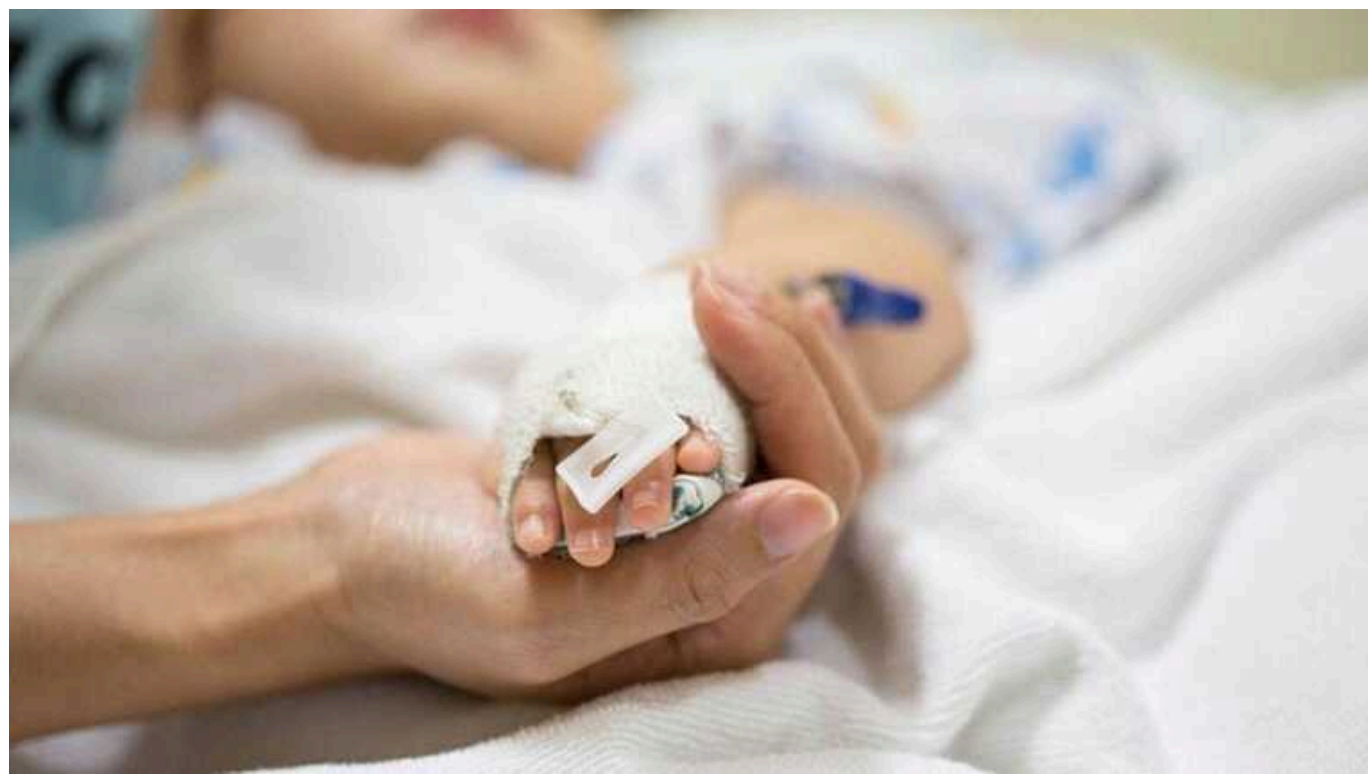
На Львівщині від коронавірусу померла 4-річна дитина

У Львівській області зафіксували смерть 4-річної дитини через коронавірус. Трагедія сталася в Самбірському районі.