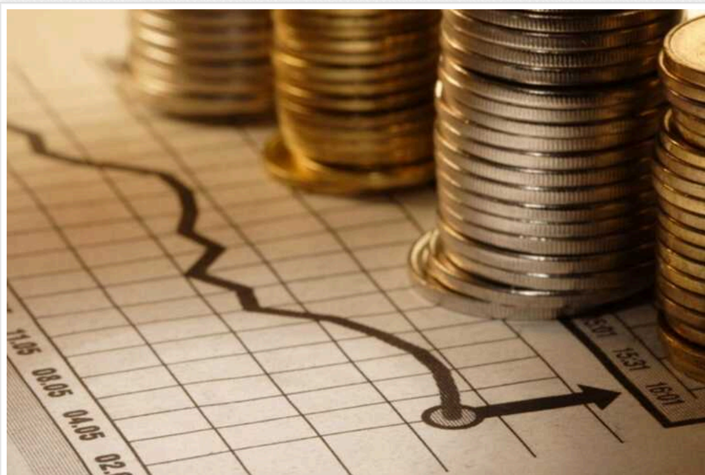
Прибутки банків в Україні досягли рекордного рівня

За перші вісім місяців 2024 року чистий прибуток українських банків збільшився більш ніж на 11% – до 106 млрд грн. При цьому податок на прибуток, який фінустанови сплатили, відповідає загальному показнику за п'ять років до початку повномасштабної російської агресії.