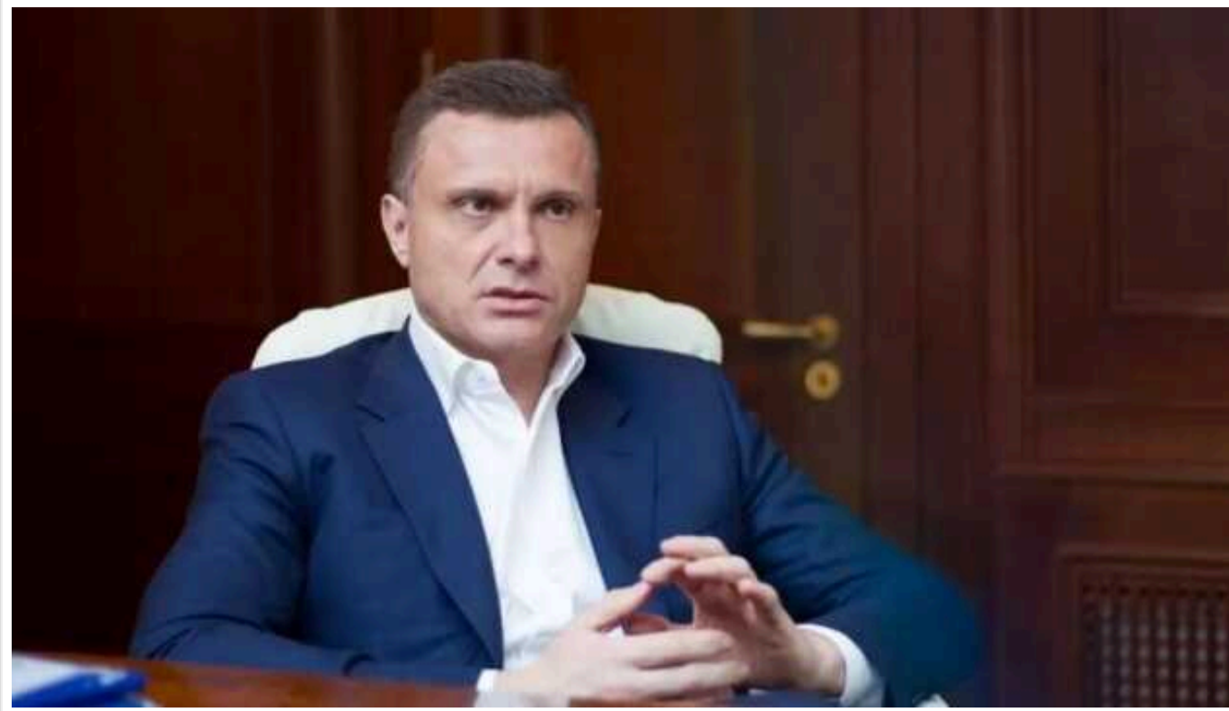
Ексглава адміністрації Януковича Львовчкін оформив опікунство над матір'ю

Народний депутат Сергій Львовчкін ("Платформа за життя та мир", яка раніше була забороненою в Україні "ОПЗЖ") улітку 2024 року оформив опікунство над матір'ю. Її визнали недієздатною через деменцію при хворобі Паркінсона.