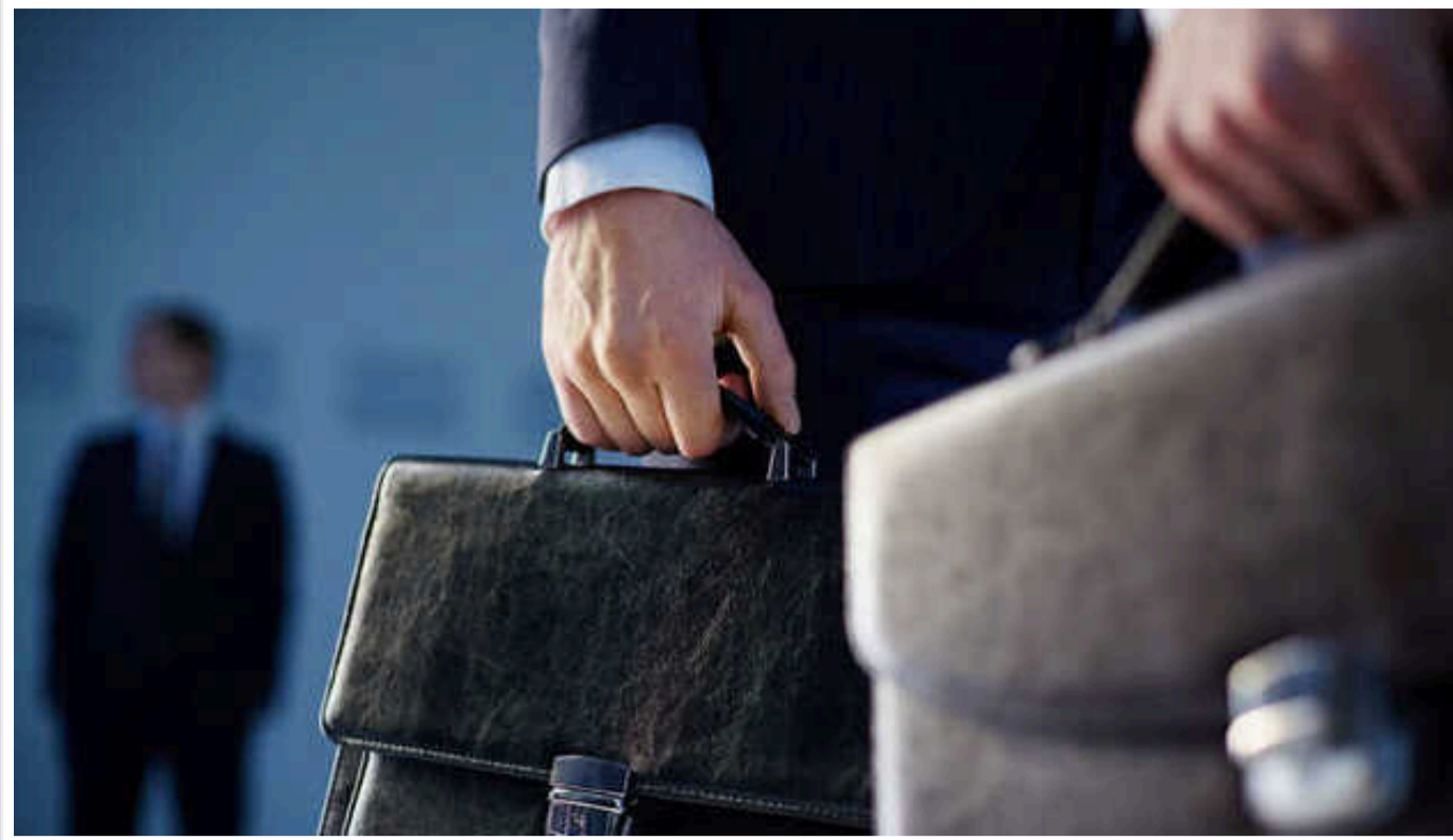
ЗМІ опублікували дані щодо зарплат держслужбовців до та під час повномасштабної війни

У проєкті бюджету на 2025 рік передбачено збільшення фонду оплати праці для деяких державних органів.