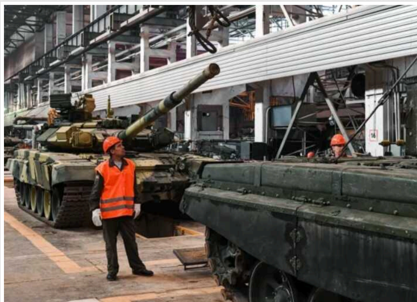
Bloomberg: Військові витрати РФ у 2025 році зростуть на чверть

За інформацією агентства, проєкт бюджету на 2025 рік встановлює військові витрати на рівні 13,2 трлн рублів (6,2% ВВП) порівняно з 10,4 трлн рублів, виділеними на 2024 рік.