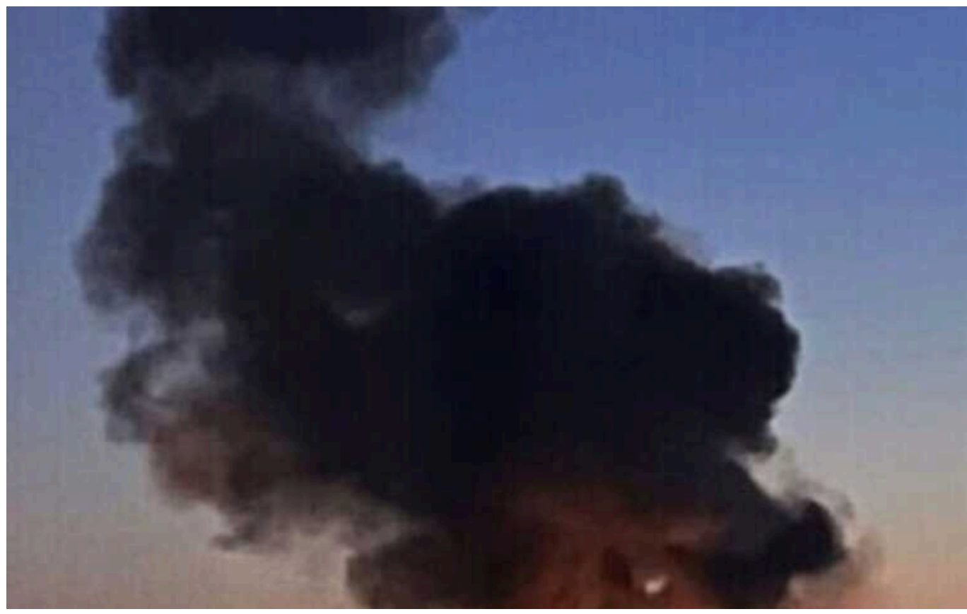
Росіяни повторно вдарили по Запоріжжю: є загиблй

Ворог влучив у об'єкт критичної інфраструктури. Виникла пожежа, яку швидко ліквідували.