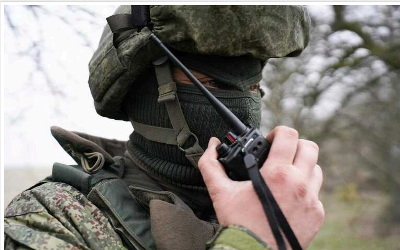
Окупанти вийшли на околиці Вугледара, - військовий

Про це повідомляє український військовий у телеграм-каналі «Говорять снайпер».