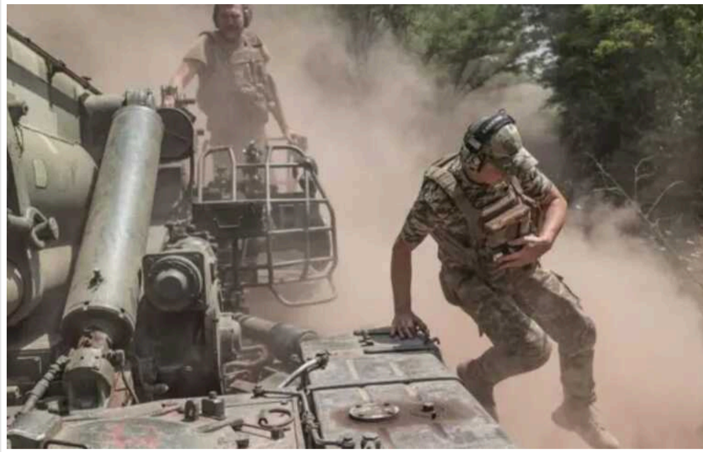
Сильно погіршилася ситуація в Харківській області між Куп'янськом і Боровою

ЗС РФ просуваються у бік дороги Борова – Куп'янськ, яка є основним логістичним шляхом у цьому районі.