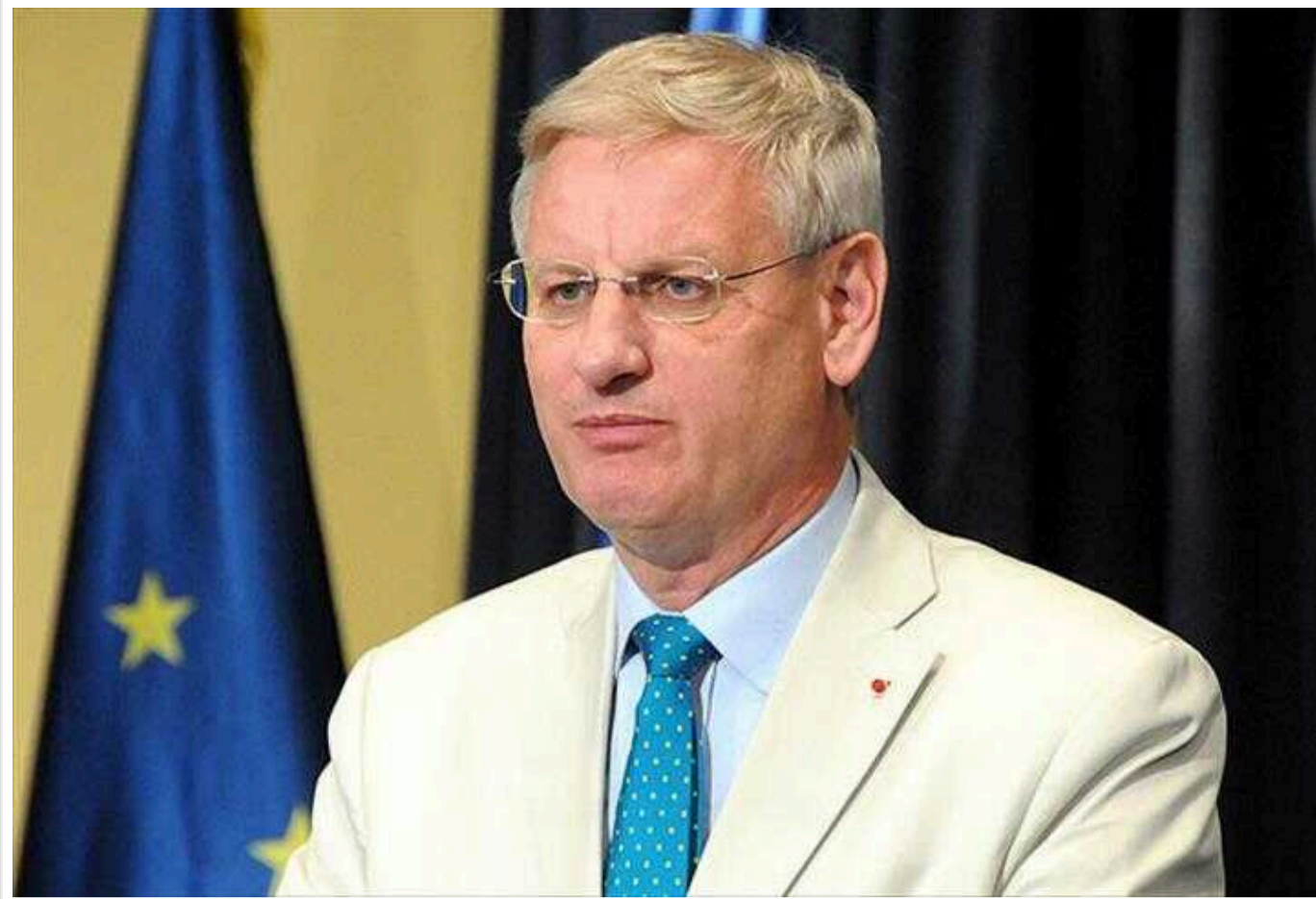
Експрем'єр Швеції назвав дві умови для стійкого миру між Україною та Росією

Для того, щоб між Україною та країною-агресоркою Росією був можливий тривалий мир, російський диктатор Путін повинен втратити владу. Додатково, Києву необхідно отримати надійний захист у формі членства в Європейському Союзі.