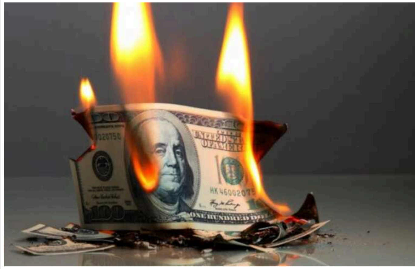
Нереалізовані збитки банків США у 7 разів перевищують рівень, зафіксований під час кризи 2008 року