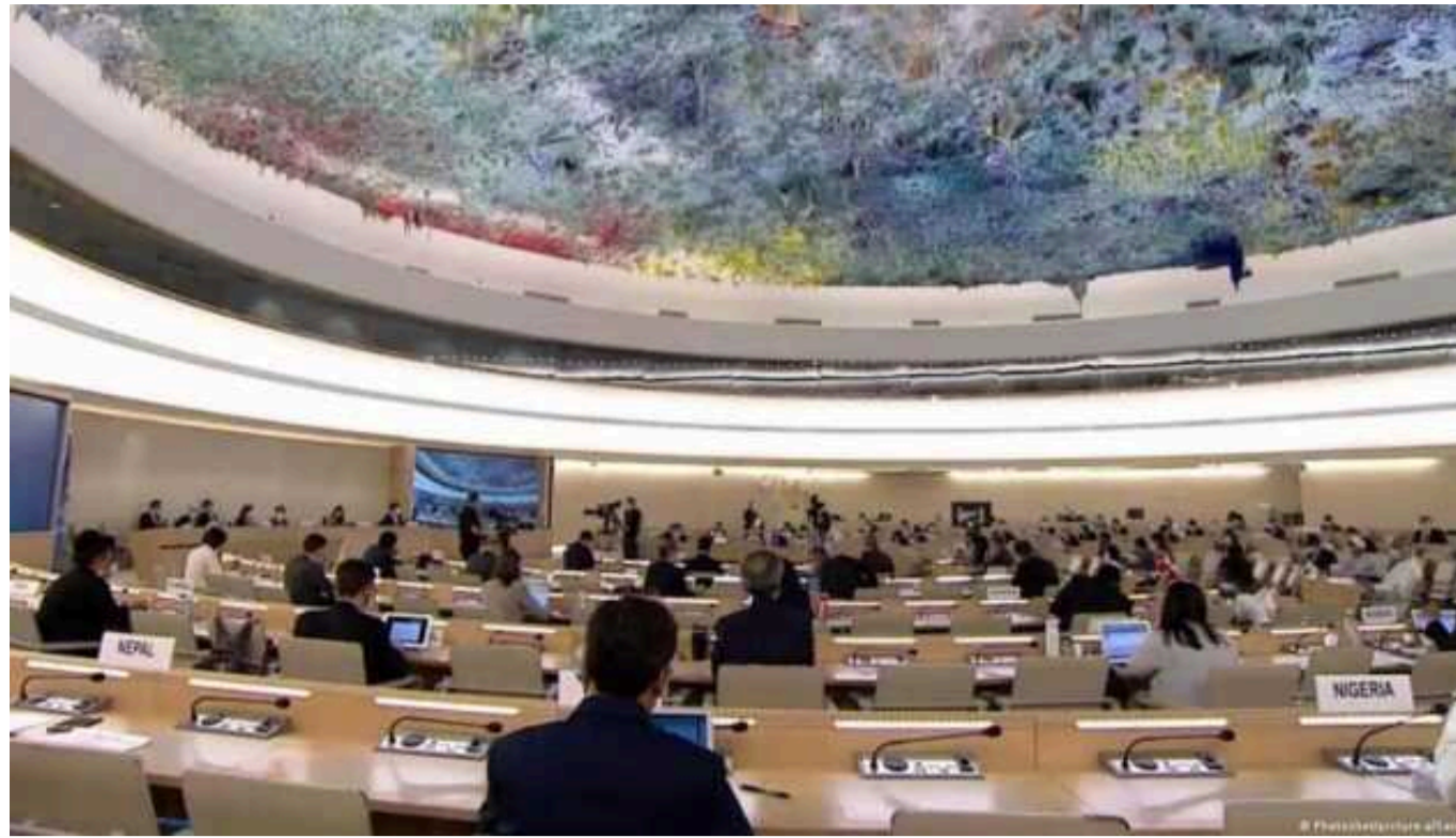
Комісія ООН виявила нові свідчення масових катувань українців

Незалежна міжнародна комісія ООН, що займається розслідуванням порушень в Україні, виявила нові свідчення поширеної практики катувань, які здійснюються російською владою стосовно українських цивільних осіб та військовополонених на окупованих територіях України та в Російській Федерації.