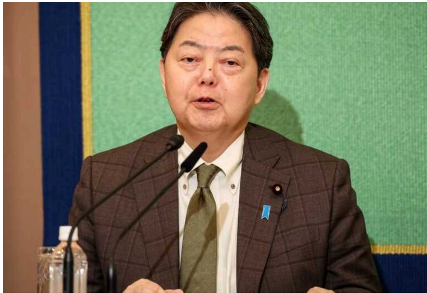
Росія протягом дня трічі порушила повітряний простір Японії

Російський військовий патрульний літак трічі порушив повітряний простір Японії поблизу острова Ребун на Хоккайдю.