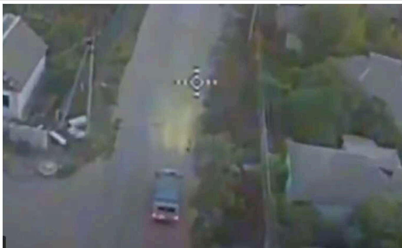
Українські прикордонники на Луганщині продемонстрували, як знищують окупантів

Підрозділ РУБпак "Фенікс" інформує про свою боротьбу з російськими збройними силами в Луганській області.