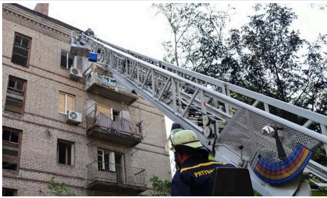
Кількість постраждалих від обстрілу Запоріжжя зросла до 22 осіб

Кількість постраждалих унаслідок нічної атаки російських військових на центр Запоріжжя зросла до 22 осіб. Серед них двоє дітей.