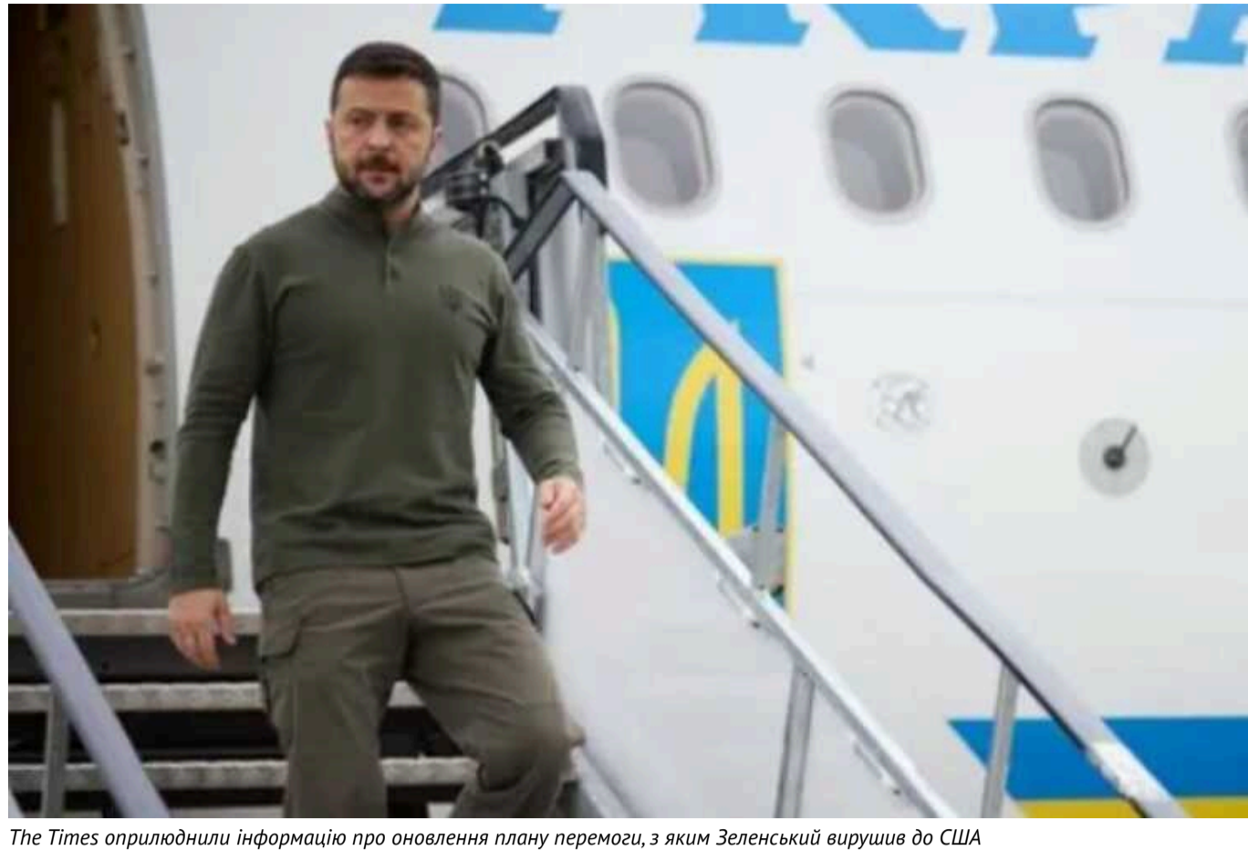
The Times оприлюднили інформацію про оновлення плану перемоги, з яким Зеленський вирушив до США

"План перемоги", який президент України Володимир Зеленський має намір представити під час візиту до США цього тижня, спрямований на отримання довгострокових гарантій підтримки від Заходу для України. Президент підкреслює, що план потребує термінової підтримки від Джо Байдена та інших західних лідерів, щоб Україна могла розпочати переговори до кінця року з вигідної позиції.