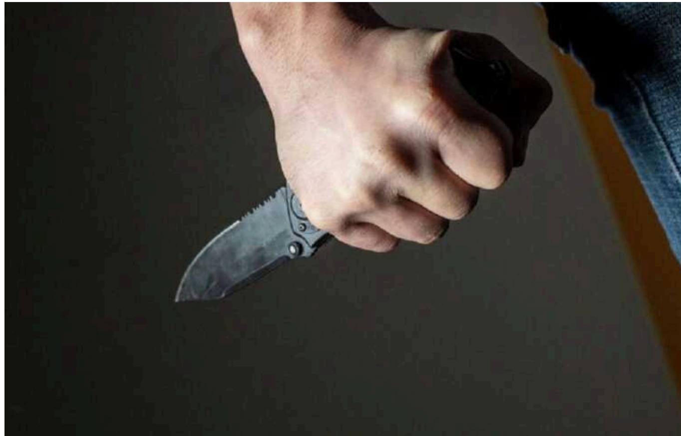
На Київщині суперечка між родичами ледь не призвела до вбивства

У селі Катюжанка Київської області під час сварки 51-річний чоловік під час сварки наніс брату співмешканки кілька ударів ножем. Потерпілого госпіталізували до медичного закладу.