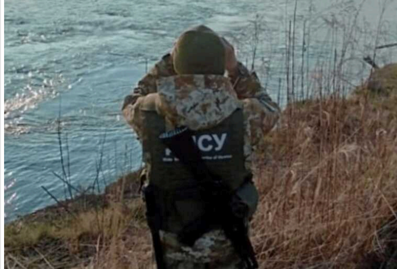
Прикордонники спіймали групу чоловіків, які планували переплисти на човні Тису

Прикордонники України затримали на Закарпатті групу чоловіків, які намагалися незаконно перетнути кордон з Угорщиною, перепливши ночі Тису на гумовому човні. Кожен з них сплатив перевізникам понад 10 тисяч доларів.